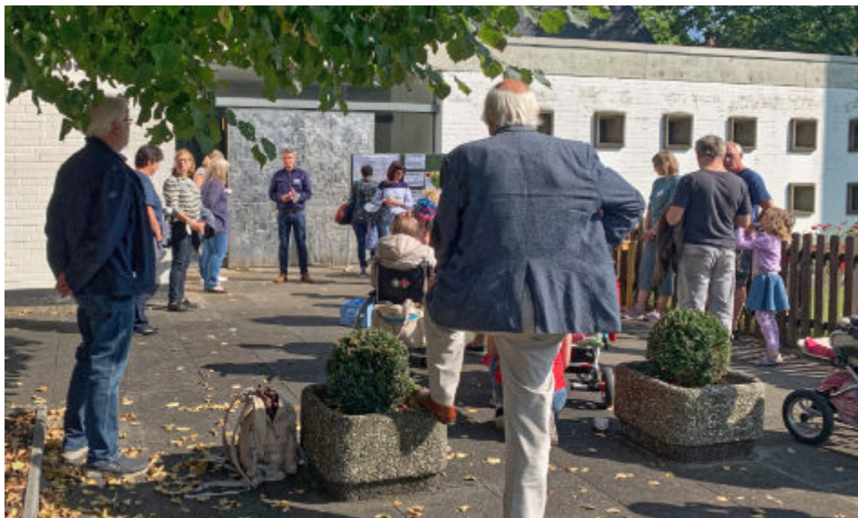
Mehr als 20 Männer, Frauen, Kinder und ein Hund begaben sich schon beim 1. Stadtteilrundgang im September 2021 auf Entdeckertour