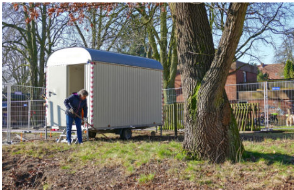
Das Gelände wird für die Eröffnung des Bauwagens hergerichtet

Die erste Bauwagen-Suppe lassen wir uns am 8. Mai schmecken – nach dem Gottesdienst, der um 11 Uhr vor dem Bauwagen beginnt. Sie sind herzlich eingeladen – bitte bringen Sie einen Suppenteller und einen Löffel mit!