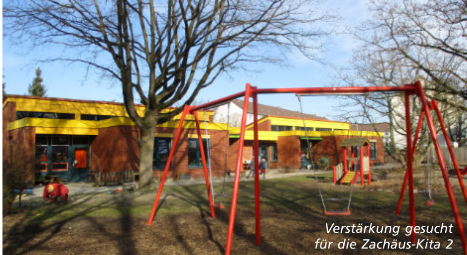
Verstärkung gesucht für die Zachäus-Kita 2

In der Kita gibt es zwei Krippengruppen und zwei altersgemischte Gruppen. Der Träger ist der Stadtkirchenverband Hannover.