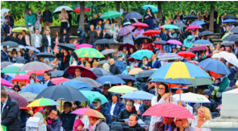
Gute Stimmung trotz launischen Wetters beim 1. Tauffest am 24. Juni 2018

Gewohnten, Vertrauten herauszuwachen, vielleicht Schwierigkeiten überwinden zu müssen, verletzt zu werden, Leid zu erfahren, vielleicht auch zu scheitern, macht Angst.